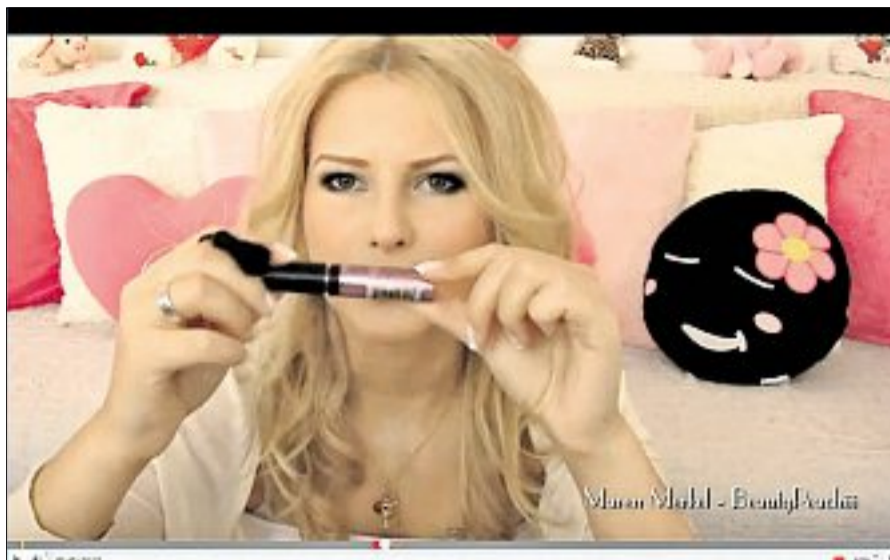
In der Kritik: „BeautyPeachii“ sieht sich dem Vorwurf ausgesetzt, in ihren Videos zu werben.