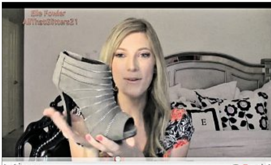
Im Erfolg: Elle Fowler hat in den USA mit ihren Videos enormen Erfolg – und verdient viel Geld.