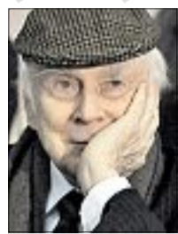
Lorient, alias Vicco von Bülow (87), in einem E-Mail-Interview mit der „Bild am Sonntag“ zur Frage nach den Lasten des Alters.

Ich sehe so manches doppelt, was mir schon einmal völlig ausreichen würde.